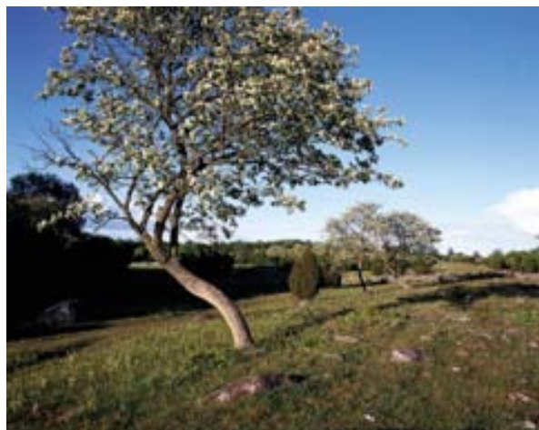
Blommande oxel på Jordtorpsåsen.