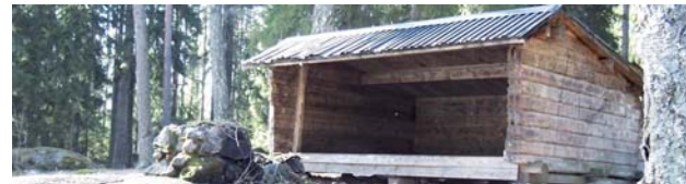
Vindskyddet vid Långsjön

Högst uppe på Stingsberget finns bänkar där det är fint att ta en rast och beundra utsikten.