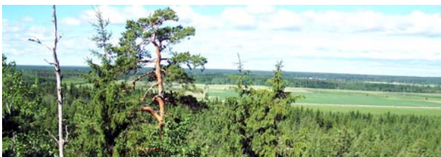
Utsikt från Stingsberget

Tallskogen fortsätter på andra sidan berget. Du kommer fram till ett vägshål där etappen går ihop med etapp nr 7 igen. Sista biten fram till Ramnäs går du först på en liten skogsväg som börjar ute vid väg 66. På väg in till centrum passerar du Ramnäs kyrka, byggd före 1450. Kyrkan har ett vackert torn med lökkupol. Utanför Ramnäs, alldeles söder om väg 66, ligger Gniens naturreservat som är en av Västmanlands artrikaste fågellokaliter.