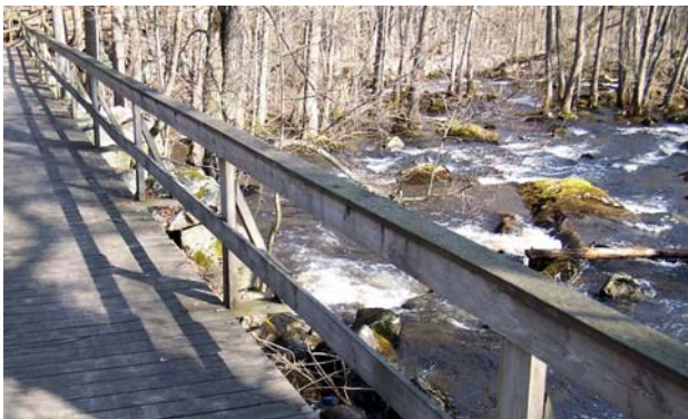
Kolbäcksån i Ramnäs

Du hittar många fina platser för en fikapaus, t ex vid sjön Grotten. Vid etappmålet stora Acktjärn är det fint att tälta. Eller varför inte ta ett dopp?