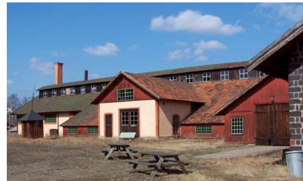
Lancashiresmedjan i Ramnäs

Idag har man i Ramnäs tre framgångsrika företag som för brukstraditionen vidare, Scana, Gunnebo och Franke Ramnäs Rostfria AB. Främst tillverkar man kättingar till bl a supertankers och oljeplattformar.